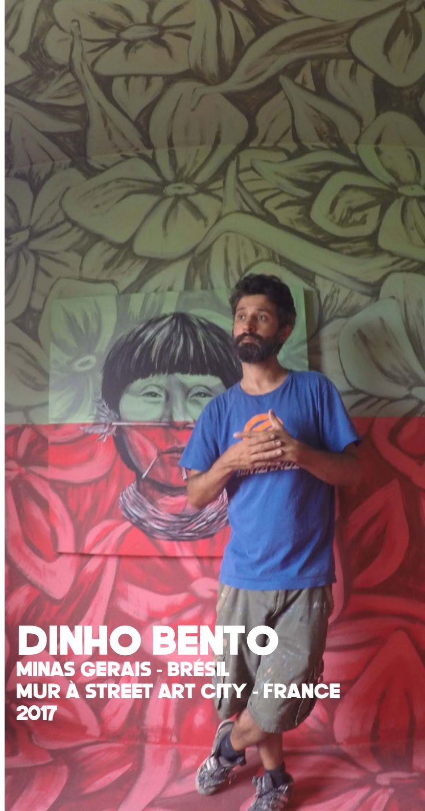
DINHO BENTO MINAS GERAIS - BRÉSIL MUR À STREET ART CITY - FRANCE 2017